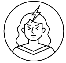
Maux de tête intenses