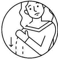
Paralyse dans les bras ou les jambes