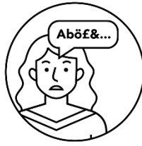
Trouble de la parole