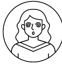
Trouble de la vue