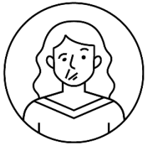
Paralyse au visage